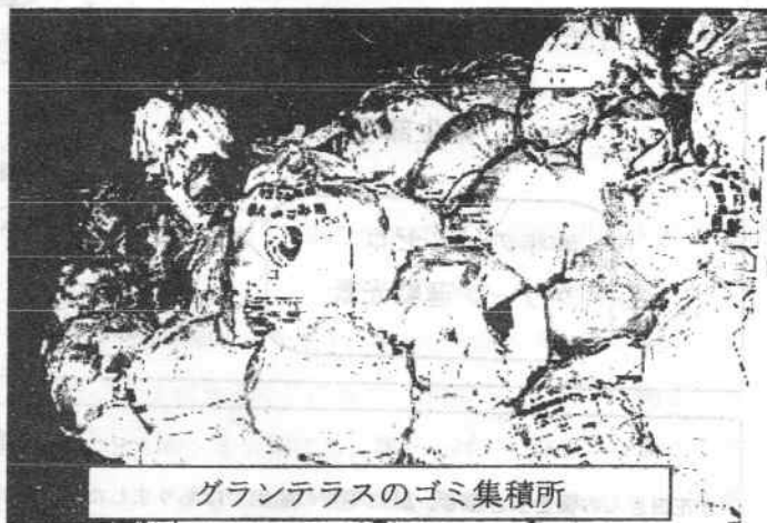
グランテラスのゴミ集積所

○3月までは、ビニール袋はもちろんダンボール箱、紙袋、何にいてもいれなくてもゴミ集積所に置いておけばよかったですから大変楽なものでした。4月からはゴミ袋は指定の袋のみとなり、その袋にいれない限り出せない訳ですから、資源ゴミは資源ゴミとして出し、極力ゴミは減らそうと思う様になりました。以前から牛乳パック、トレイ等はまとめてスーパーへ持って行っていましたが、お菓子の紙箱や封筒などの紙もためて資源ゴミとして出すようになりました。資源を無駄にしない為にもしっかりと分別しようと思っています。