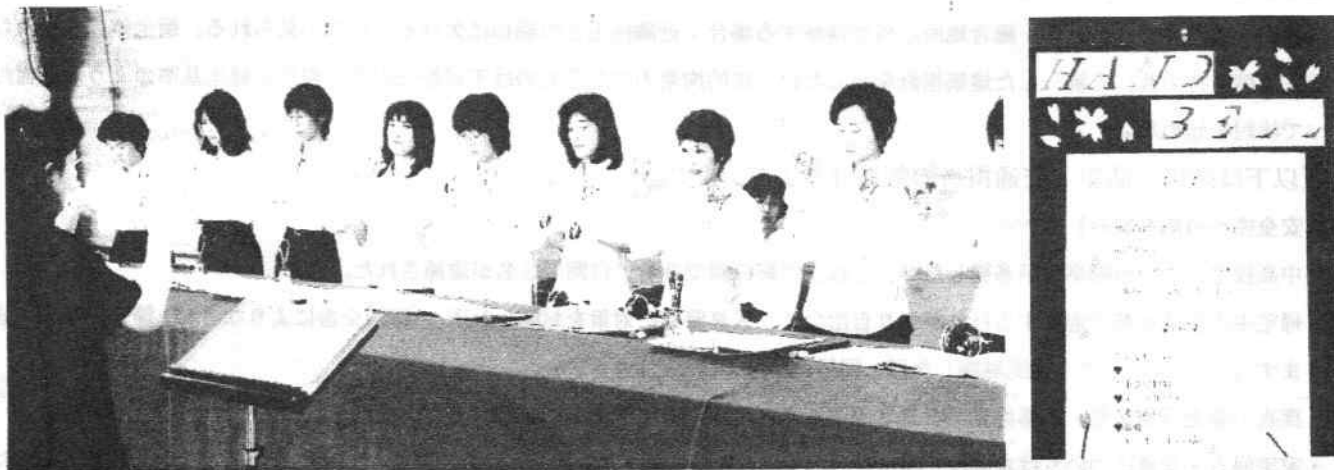
総会に先だってハンドベルの演奏が披露されました