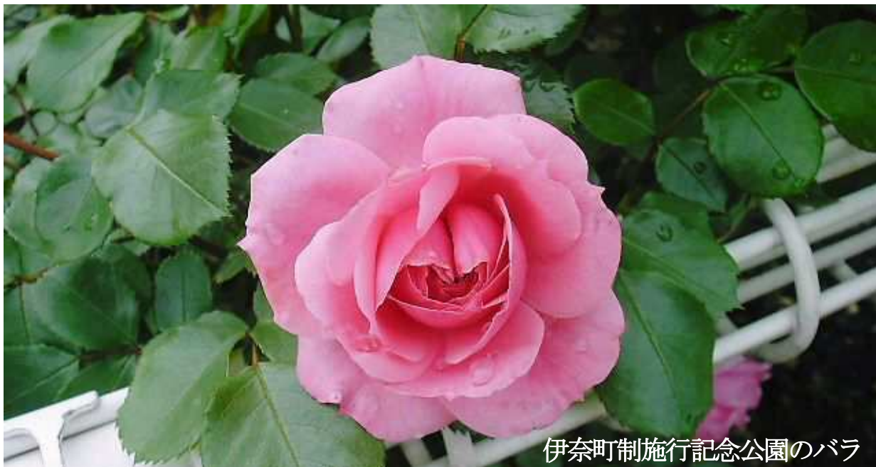
伊奈町制施行記念公園のバラ