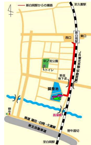
イラスト or 写真

初夏の朝、清々しい空気と美しい花を求めてお散歩に出掛けてみてはいかがでしょうか?