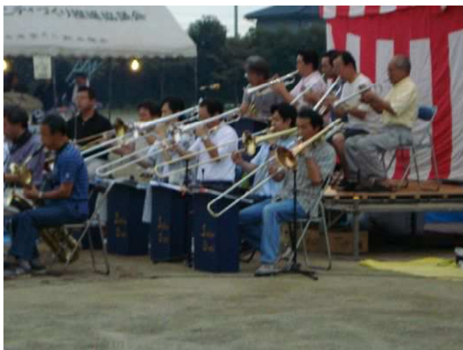
明るいうちから徐々に雰囲気盛り上がりです

来年は、自治会創立20年記念の納涼盆踊り大会であり、例年よりも規模・内容を充実させた大会となることでしょう。担当役員・班長の方のご活躍を祈念いたしております。