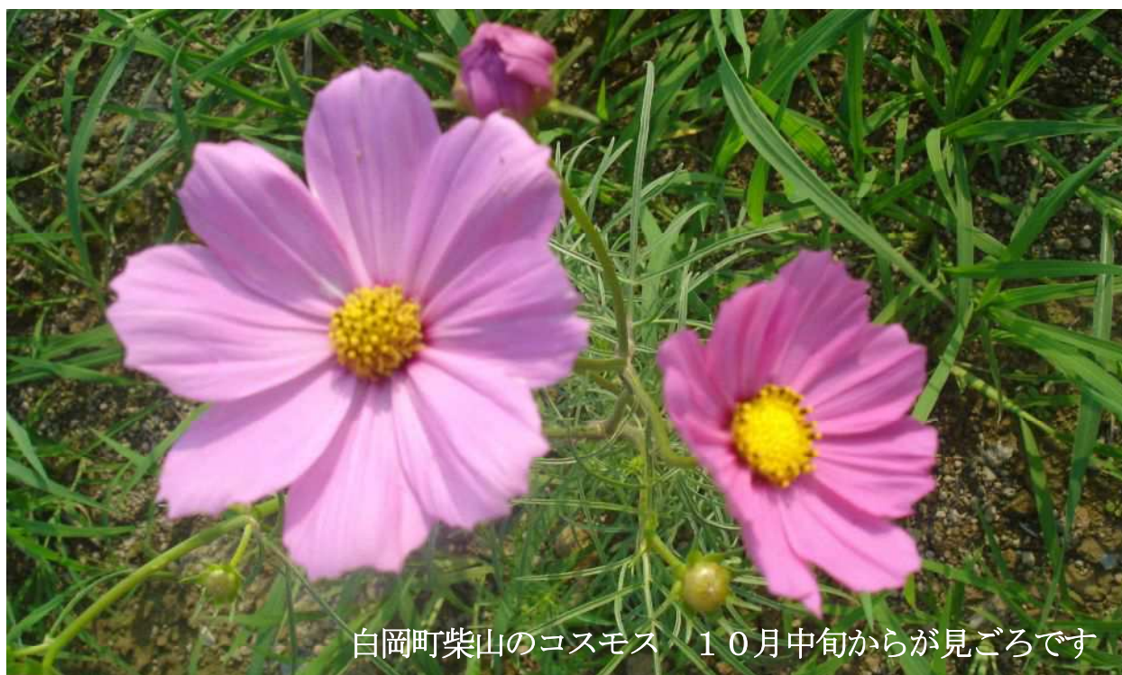
白岡町柴山のコスモス 10月中旬からが見ごろです