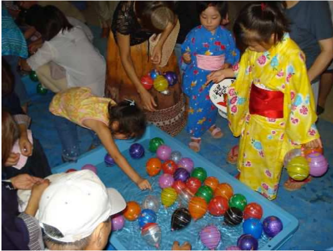
子どもたちに大人気！ ヨーヨー釣りとスーパーボールすくい