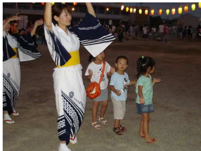
小さい子どもからお年寄りまで踊りの輪が二重三重に広がりました