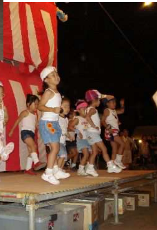
日頃の活動の成果を存分に 披露していただきました