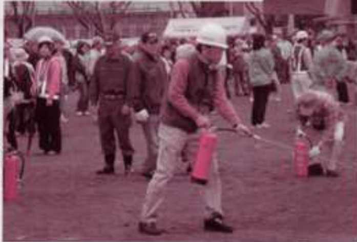
「自分たちの町は自分たちが守る」