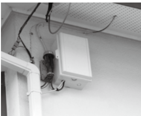
BS対応ブースター（戸外設置）