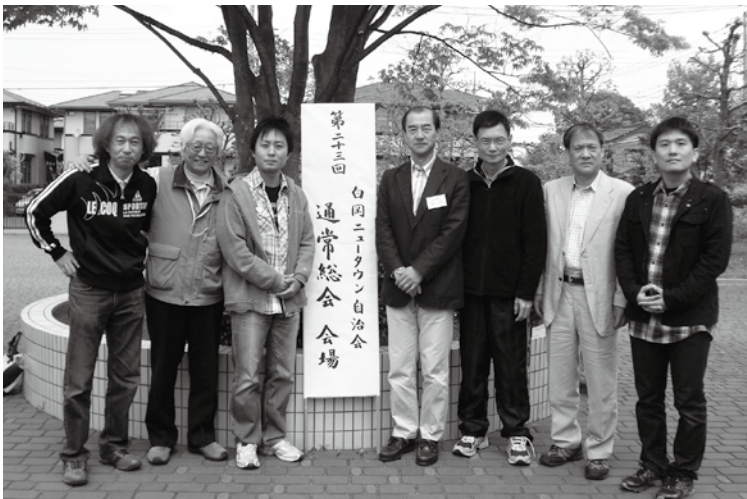
退任されました役員の方々です

平成20年〜23年度の3年間、会計を担当しました。初めての自治会活動でしたが、会長ほか関係役員、事務局の皆さんのご指導・ご協力により何とか全うできたことを感謝しております。今後とも、ニュータウンの発展、自治会活動の発展を祈念しております。