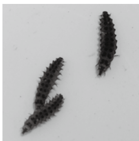
ホタルの幼虫です