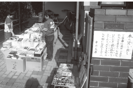
2-24-18 事務局長の緑道を東小へ向かい、右手のお宅です

の物を大処分。本も沢山処分してしまつたのですが、それでも本棚には読み直したい、と思う本が沢山残りました。それを眺めているうちに、返却期限を設けない文庫を開こう、と思いつき、大人用図書も含めた文庫をガレージで始めました。 最後にお問い合わせがあります。新刊本もあります。皆様方のご家庭でご処分予定の本がございましたら、ご提供いただけますと本のジャンルも幅広く大助かりです。どうぞ宜しくお願いいたします。