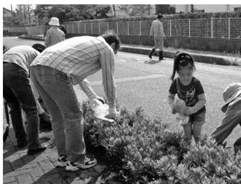
植樹会で美しい街並みに

思い起こすに白岡ニュータウン入居当時はまだまだ未熟な町でしたが、早、自治会発足24年目に入り、ますます緑豊かで、安全な住みやすい町に成長致しました。これもひとえに住民皆様の力です。さらなる「花と緑の明るいニュータウン」をスローガンに、前進したいと思えます。皆様のご協力のほどよろしく御願致します。