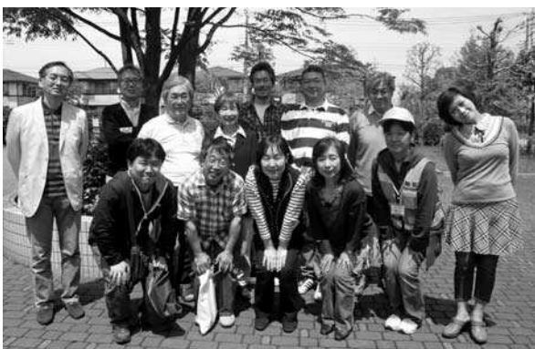
退任役員の皆様、ありがとうございました

これまで距離を置いて見ていた地元地域活動が、これからは、より身近な存在として向き合えるようになったと思います。