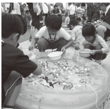
今年も夏祭りに来てね

事業部では今年度も「夏祭り盆踊り大会」と、「青空市&餅つき大会」の、開催を予定しております。子供達の良い思い出に出来るように又、色々な年代の方楽しんで頂ける行事になるよう努めて参りますので、ご参加ご協力をよろしくお願ひします。