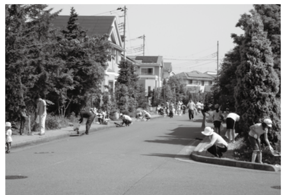
毎回多くのご参加ありがとうございます

尚、7月にシルバーさんが草取りをしてくれました。1年間を通じて、花と緑のニュータウンでありたいと思います。