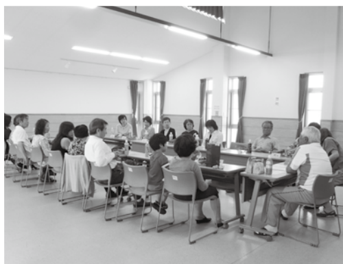
1丁目集会所を利用した班会議

難しいテーマではありませんが、各班で災害時の行動を確認し、話し合うきっかけになったようです。たとえば近所でも年1回しかお会いしない方もいるので、世代の違う人の貴重な意見を聞くことが出来たのではないのでしょうか。共通テーマの他に、町や自治会への意見や要望も意見交換されています。