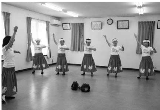
わきあいあいのサークル