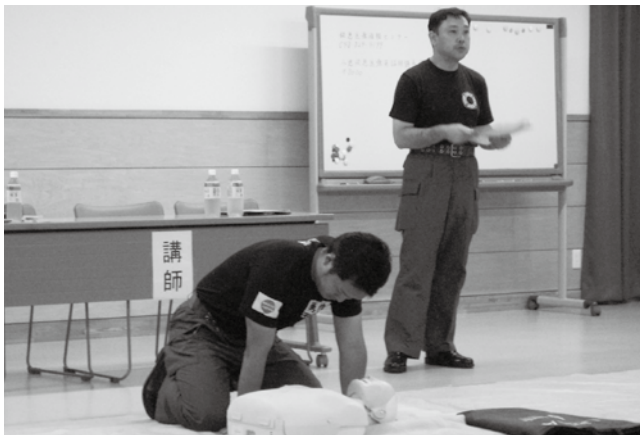
白岡町消防署員の方が講師です

呼吸が止まってしまいます。ついさつきまで元気にしていたのに、突然、心臓や呼吸が止まってしまった…。こんな人の命を救うために、そばに居合わせた人ができる 応急手当 のことを 救命処置 といいます。