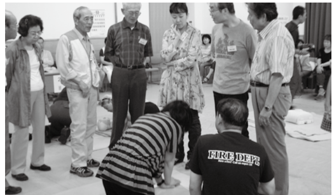
心臓マッサージの練習に真剣なまなざし

傷病者の命を救い、社会復帰に導くために必要となる一連の行いを「 救命の連鎖 」といえます。