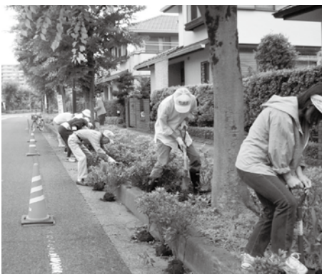
花と緑の維持には人力が大切

後期は10月にオオムラサキの植樹会2回目を予定し、また同月には「剪定講座（剪定の目的と基本）」を計画、会員皆様の参考になればと願っております。白岡ニュータウンの幹線道路にはオオムラサキ、会員皆様の庭には個性豊かな花・木で「花と緑」が益々見ごたえのある町になるよう、会員皆様のボランティア活動へのご協力を頂きながら、植樹部として責任を果たしたいと考えております。