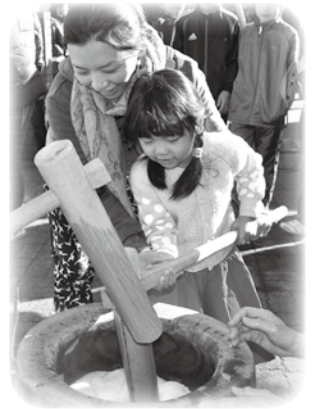
ちびっ子たちがお餅をついてくれました。ありがとう！