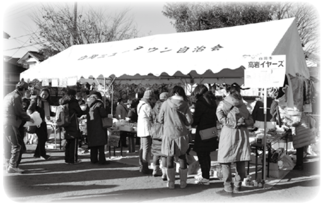
フリーマーケットは地域のみなさん…