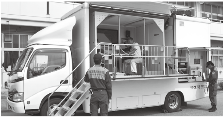
起震車で体験はいかがでしたか？

住民が日頃からの世帯構成や暮らしを分かっているなければ、災害発生時の助け合いは難しいと言われます。同じ街区の人たちが協力して行動する防災訓練は、こうした相互理解を培う絶好の機会です。今後は多くの方々の参加をいただきたいものです。