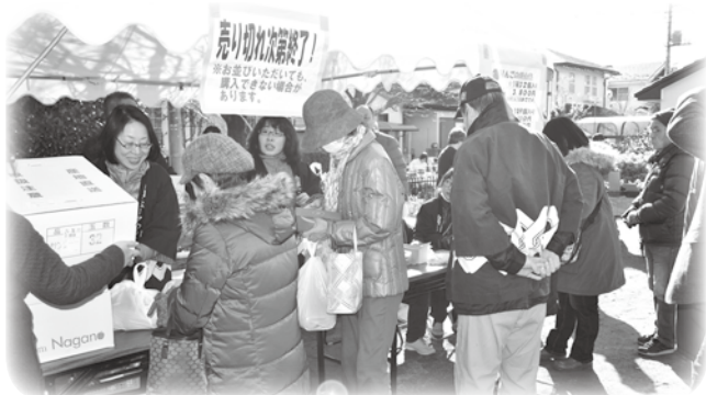
ことしも早くから！ りんご販売行列ができました

「リンゴの販売数をもっと増やしたら」と。生産者の都合と天候との兼ね合いがあり、難しい判断ですが、検討したいと思います。