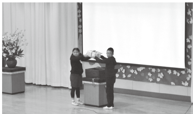
自分へのメッセージ、十年後が楽しみだね！