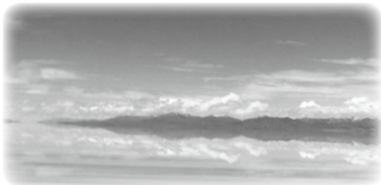
天空の鏡は広大な湖でした！

今回は、天空の鏡である「ウユニ塩湖」を紹介します。 ウユニ塩湖は幅・長さ100km以上、四国の半分近い面積が一面塩で覆われた「世界最大の平坦地」です。 塩原には、周囲の集落を結ぶ「道路」があります。道路と言っても、白い塩の地面にタイヤの跡がうっすら見えるだけです。このルートを、乗合バスや土地の人の車は平気で走ります。更にはツアー客を乗せた観光業者の四輪駆動車も走っています。夜の塩湖は方向感覚が無くなってしまいうため、地元の人はずきまきません。塩湖から戻らず、翌日いくら探して見つからなかった車が何台かあると聞きました。