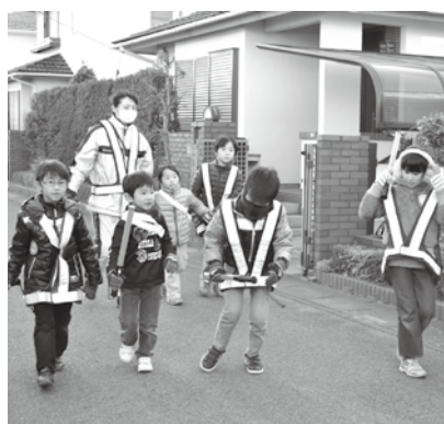
寒い中頑張ったね!

「自分たちの街は自分たちで守る」を合言葉に始まった「歳末警戒」もかれこれ二十年以上の歴史があります。昨年十二月二十七日、二十八日に大人147名、子供15名と多数の参加者を得て開催しました。今回は、久喜警察署と駅前交番の職員の方にも参加を頂きました。『戸締りしっかり・火の用心』という力強い声が町中に響き渡らせたことは安全・安心を願う街づくりに役立っています。ありがとうございました。