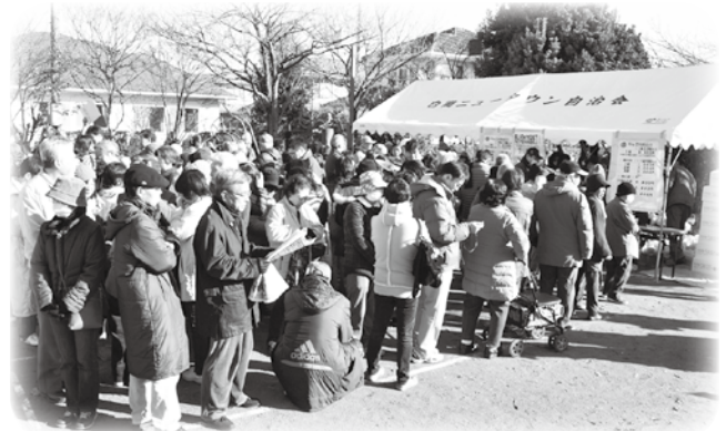
“お待たせしました”