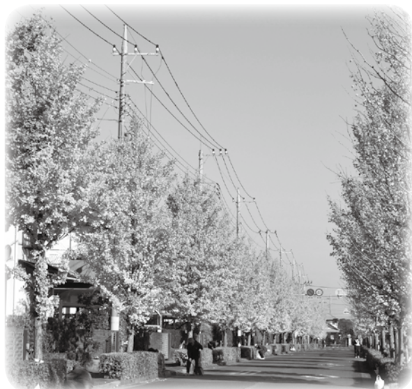
学園通りのイチョウ並木

～挨拶と花と緑の明るいニュータウン～ 安全で安心して暮らせる街づくりを実現しよう！ 守ろう！住環境維持のルールとペットマナー