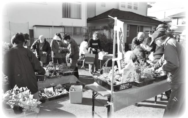
花や苗は飛びように売れました。