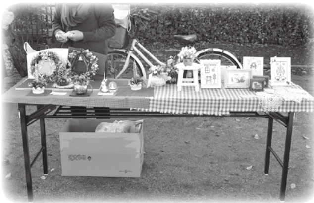
手づくり作品も注目を集め…