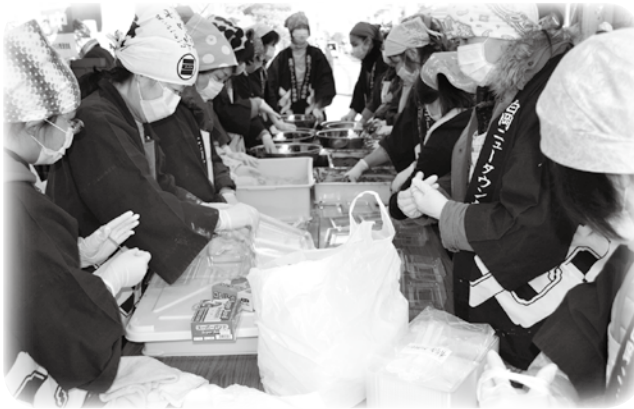
あんこやきな粉をまぶしているところです。