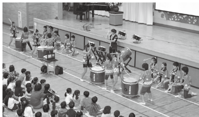
お囃子クラブの発表