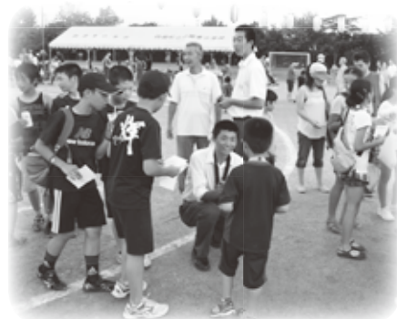
球児との写真撮影と サインの対応