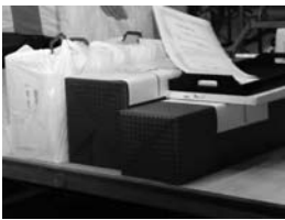
豪華景品は誰の手に!?