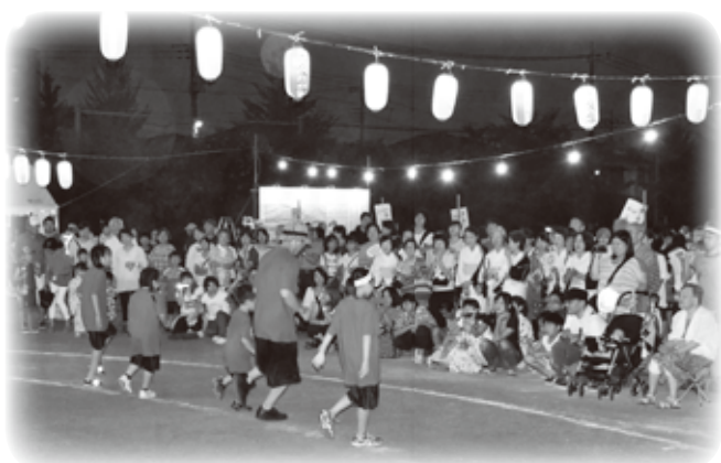
ヒップホップダンス