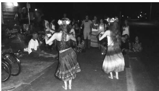
娘さんのフラの披露