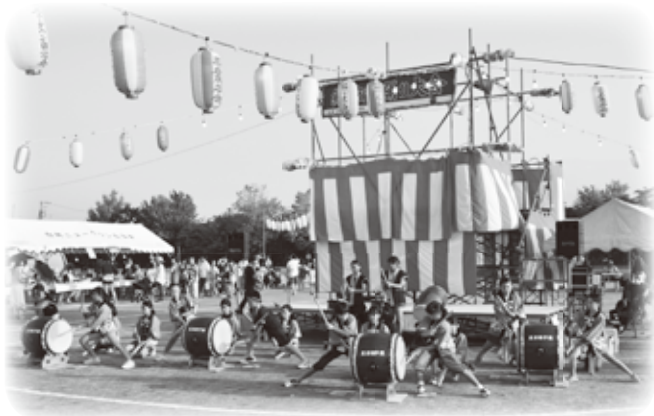
白岡東小和太鼓クラブ