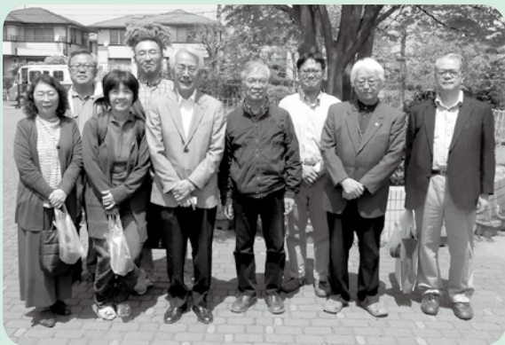
自主防災会新役員

近隣行政区の備蓄状況は現段階で把握していません。平成30年度の防災訓練は、近隣行政区との合同開催（先方のご了解が頂けるなら）を検討中だが、その過程で情報交換を行っていききたい。なお、東小学校に設置されている市の防災倉庫には、近隣行政区分も含めた備蓄品が保管されています。