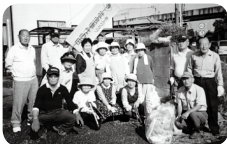
地域で清掃活動の一コマです