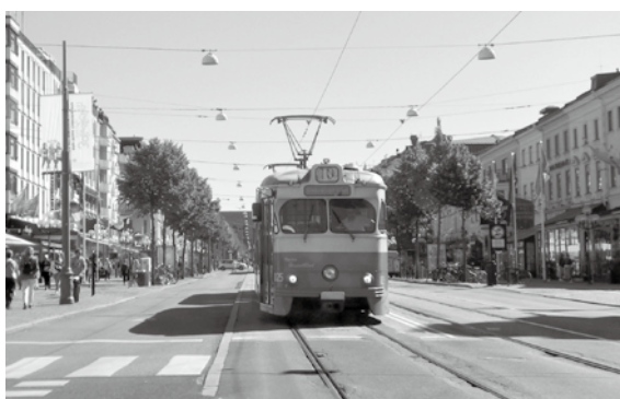
イエーテボリの市街地。トラムと呼ばれる路面電車は市民の足です

ムをつけて一緒に食べるのが定番です。これが会社の食堂でも必ず木曜日に出されます。なぜ毎週木曜日に出されます。上自衛隊カレーの話を知っているでしょうか。長く海の上を航海する隊員さんたちが曜日の感覚を無くさないように毎週金曜日にカレーを食べるという。これと同じ目的で、毎週木曜日に食べられているのが『ピースープ』なのです。