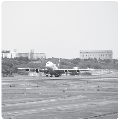
離陸するタイ国際航空のA380