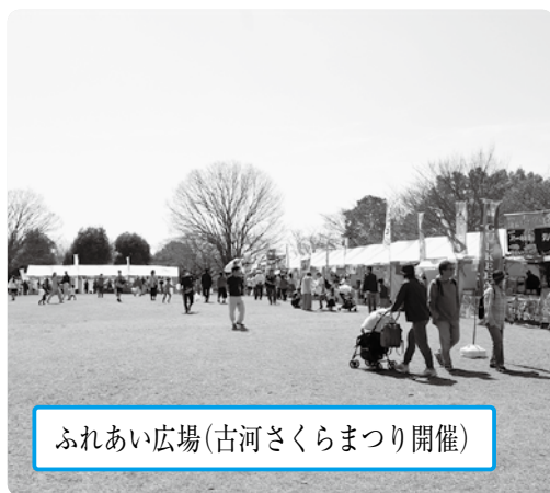
ふれあい広場(古河さくらまつり開催)

園内には、そば処や焼き立てパンの販売所もあり、一日中遊ばせています。遊歩道なども整備されており、桜が咲く季節に歩くとても気持ちが良いですよ。