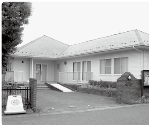
3丁目集会所の現在(令和6年)