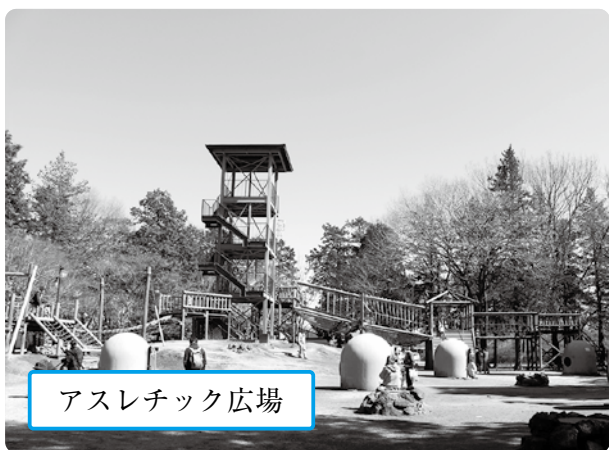
アスレチック広場

バーベキュー、キャビン（宿泊施設）、キャンプサイトの利用は予約制（有料）で、食材の手配は自分で準備をする必要がありますので、手ぶらでバーベキューはできませんが、みんなで好きな食材を持ってくれば、楽しいと思います。小学校高学年以上のお子さんには、これらの施設の他として、釣り堀は如何でしょうか？ 竿・えさ付きで大人50