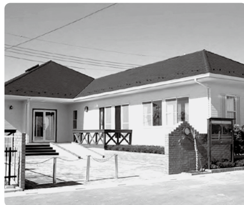
3丁目集会所開設当時(平成元年)