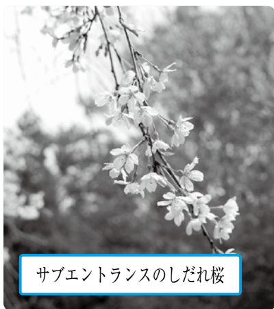
サブエントランスのしだれ桜